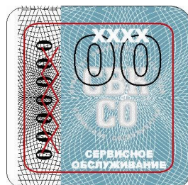
Описание элементов знака «Сервисное обслуживание»